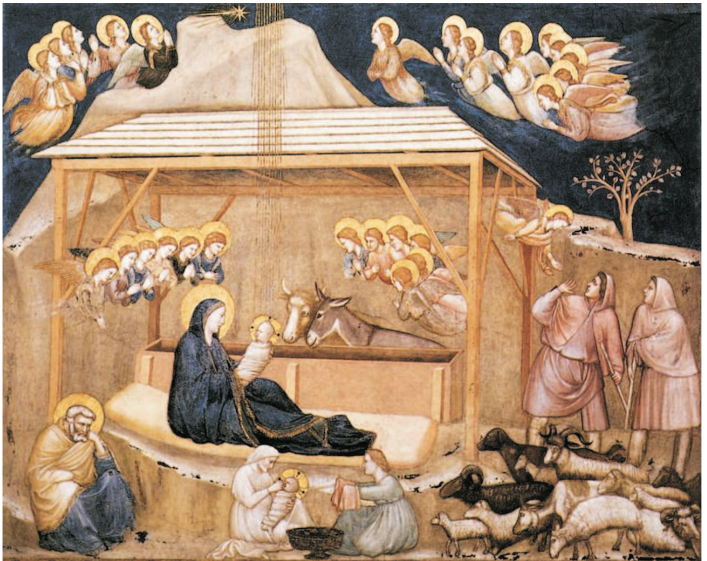
Giotto - La Natività

La Redazione del giornale porge ai lettori i migliori auguri di Buon Natale e Prospero Anno Nuovo.